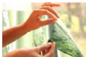
15. Se poate dezlipi oricand fara urma