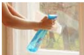
2. Sterge geamul