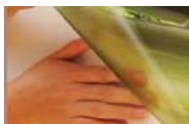
6. Scoate fotografia de pe folie