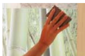
11. Cu un burete scoate apa