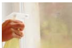
7. Umezeste geamul