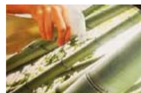
8. Umezeste Fotografia pe dos